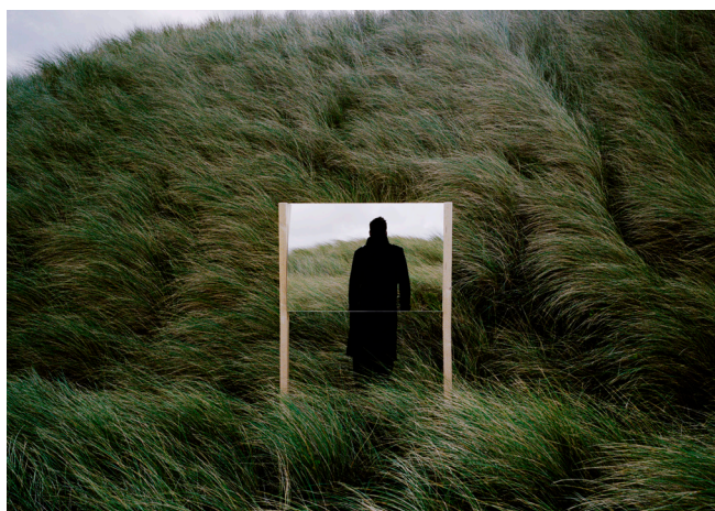
Campos Abiertos Guillaume Amat

El objetivo es convocar no sólo a fotógrafos, artistas, sino también a amantes de la fotografía residentes en Bogotá para que presenten un proyecto inédito de 5-10 imágenes. Donde se explore el territorio desde una nueva óptica, se haga visible los procesos “líquidos” que se llevan a cabo en nuestra sociedad teniendo en cuenta el momento de profunda transformación por el que atraviesa el país en el que el despojo de tierras, los desplazamientos, la violencia y las migraciones hacen evidente el proceso líquido de nuestro territorio. “Territorio es el espacio físico que habitamos pero sobre todo son los terrenos conceptual, intelectual, técnico, artístico y emocional que dominamos como sociedad y como individuos.”